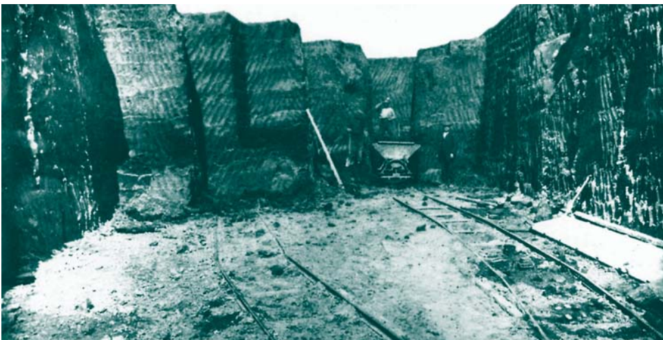
FIGUUR 0.2 Afgraving van de terp van Eenum in 1916

DEVENTER, 21 OKT. Archeologen hebben in Deventer grote delen blootgelegd van het Elizabeth Gasthuis, een inrichting voor ouderen, geestelijk gehandicapten en psychiatrische patiënten. De vondsten in de Smedenstraat dateren uit de negende tot begin twintigste eeuw en geven een beeld van de ontwikkeling van het gasthuis en de burgerlijke bewoning eromheen. De oudste vondsten zijn resten van houten woningen uit de negende eeuw. Rond het gasthuis zijn bijgebouwen aangetroffen met resten van ambachtelijke activiteiten zoals van een bronsgieterij en van een kacheltegelbouwer. Ook zijn er resten gevonden van een huis dat begin vijftiende eeuw vermoedelijk toebehoorde aan een hoogwaardigheidsbekleder. De afgravingen duren tot half december. Daarna wordt er een nieuw verpleeghuis gebouwd. (ANP)