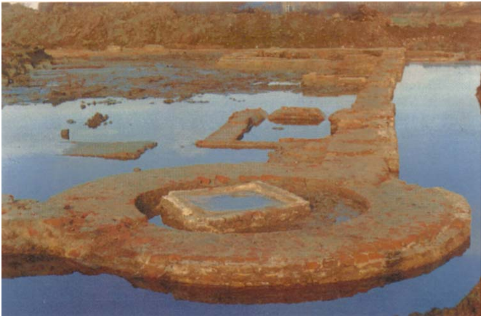
FIGUUR 0.1 Sporen in het bodemarchief: de fundamenten van het kasteel West-Souburg

De schriftelijke bronnen worden bewaard in archieven: landelijk in het Nationaal Archief in 's-Gravenhage, provinciaal in de rijksarchieven in de provinciehoofdsteden, op veel plaatsen al met stedelijke archieven gecombineerd tot Regionale Historische Centra. Daarnaast zijn er speciale archieven, zoals de kerkelijke archieven en de waterschapsarchieven.