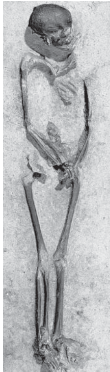
FIGUUR 0.3 Tijdens archeologisch onderzoek bij de aanleg van de Betuweroute werden menselijke resten gevonden, het oudste skelet ooit opgegraven (7.000 jaar oud). Het skelet kreeg de naam Trijntje

Het bodemarchief geeft bij toeval herhaaldelijk schatten prijs. Schatten die aan de oppervlakte komen door natuurlijke ontwikkelingen, bijvoorbeeld aardverschuivingen, of door menselijke activiteiten, bijvoorbeeld door ploegen. Bij toevalsvondsten is het voor de archeoloog van groot belang dat vastgesteld wordt waar en onder welke omstandigheden de vondst gedaan is.